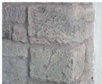
FASE 8 Lavoro finito