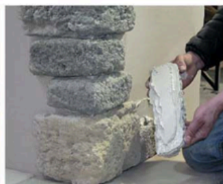
FASE 3 Applicare il collante sulla tavola da posare