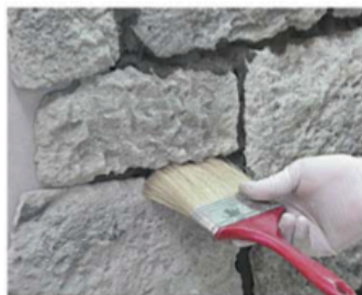
FASE 7 Dopo circa 30 minuti, quando lo stucco è consistente, rimuovere quello in eccesso e uniformare con un pennello