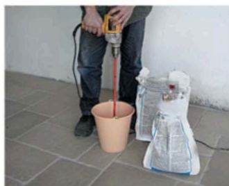
FASE 1 Preparazione del collante.

Fare aderire le singole tavole alla superficie di posa, premendo con movimento "avanti-indietro" affinché la colla ne fuoriesca da ogni lato della tavola.