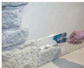
FASE 2 Applicare il collante con una comune spatola sulla parete da rivestire