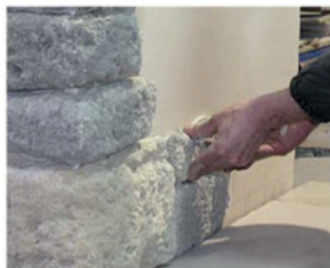
FASE 4 Fare pressione sulla parete spostando la tavola da destra a sinistra e dall'alto verso il basso