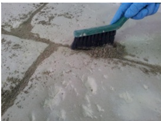
Fase 3: Eliminazione stucco in eccesso