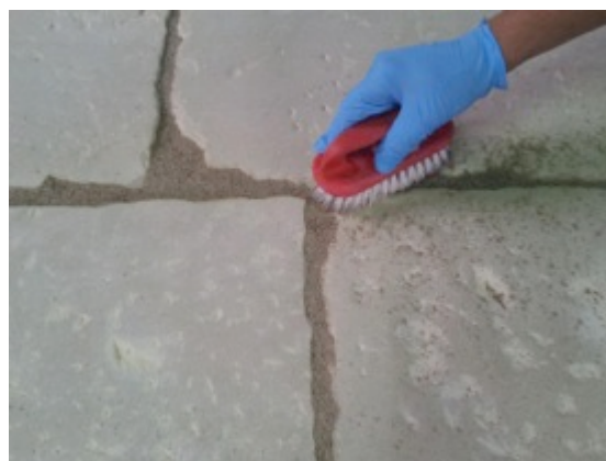
Fase 4: Pulizia finale