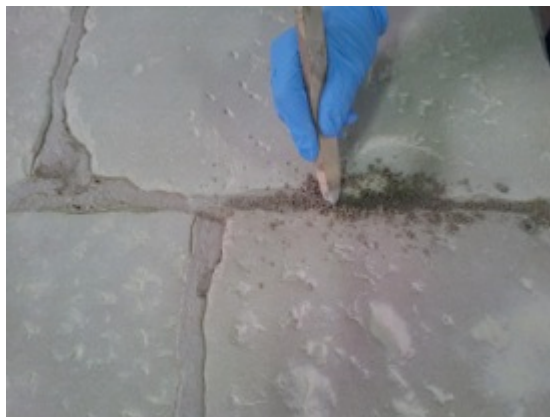
Fase 2: Ritocco delle fughe