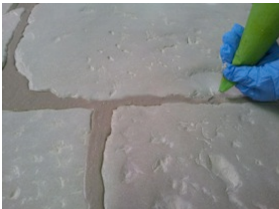
Fase 1: Riempitura delle fughe